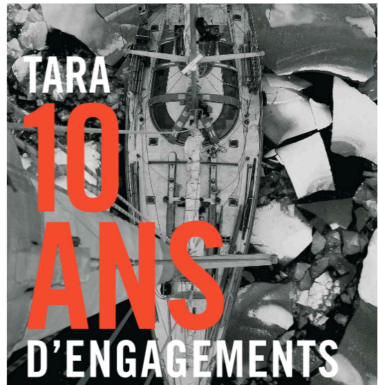
En 2013, le voilier d'exploration Tara a fêté ses 10 ans d'engagements

En 2013, Tara a fait escale à : Paris, Le Havre, Roscoff, Bordeaux, Thorshavn (Feroe), Tromsø, Murmansk, Dudinka, Nagurskaya, Pevek, Tuktoyaktuk, Arctic Bay/Pond inlet, Ilulissat Québec, Saint Pierre-et-Miquelon et Lorient.